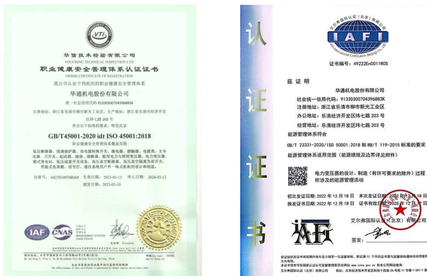
图 4-1 认证证书