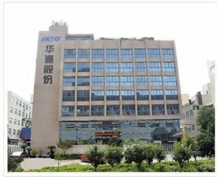
图 1 公司园区