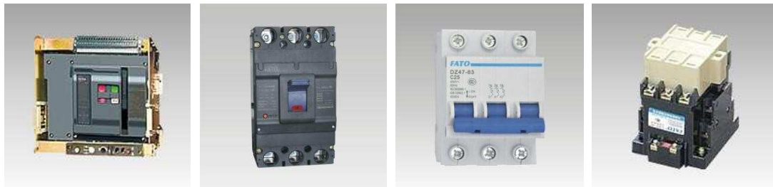
图 2 公司产品